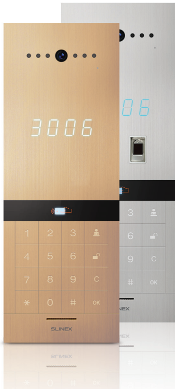
Многоквартирная IP панель Slinex Sitara