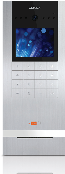
Многоквартирная IP панель Slinex Astor